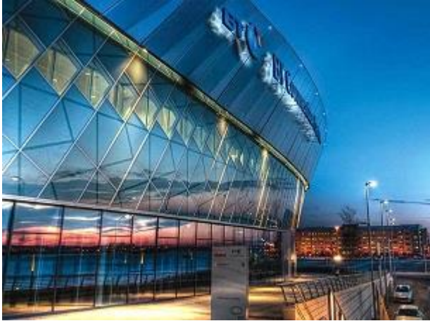
会場: Convention Centre, Liverpool

感いたしました。また普段、ゆっくりお話しする機会のない先生方とお会いすることができ、現状や今後の小児脳神経外科について歓談する機会を得て大変、楽しい時間を過ごすことができたことを感謝いたします。